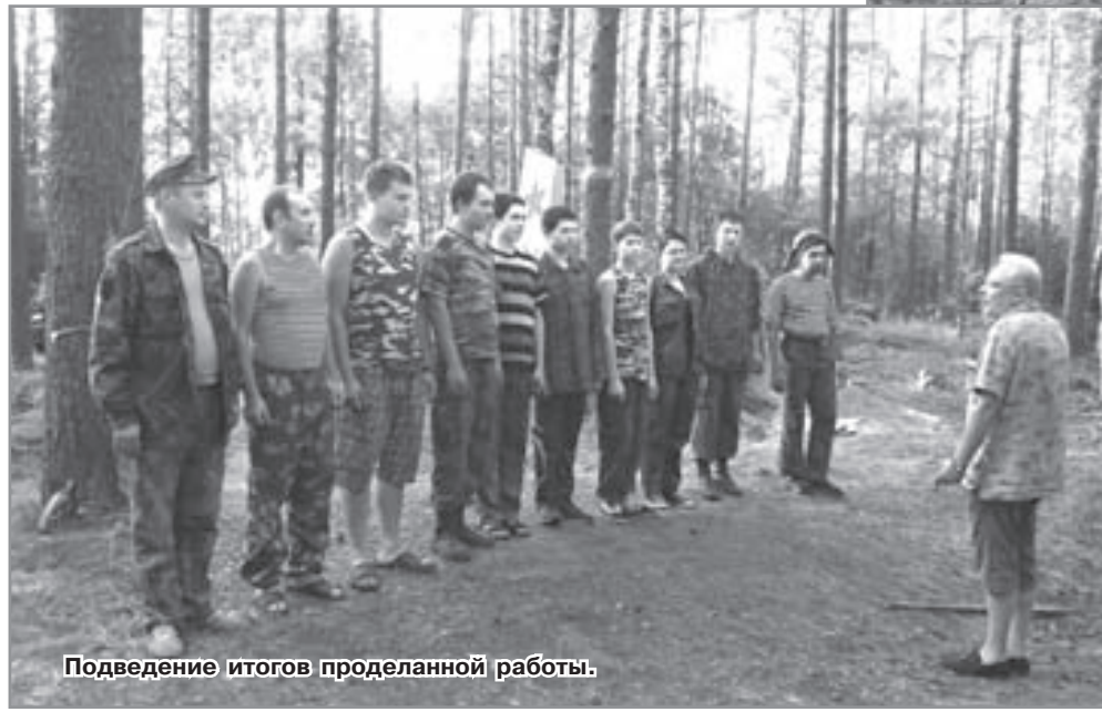
Подведение итогов проделанной работы.