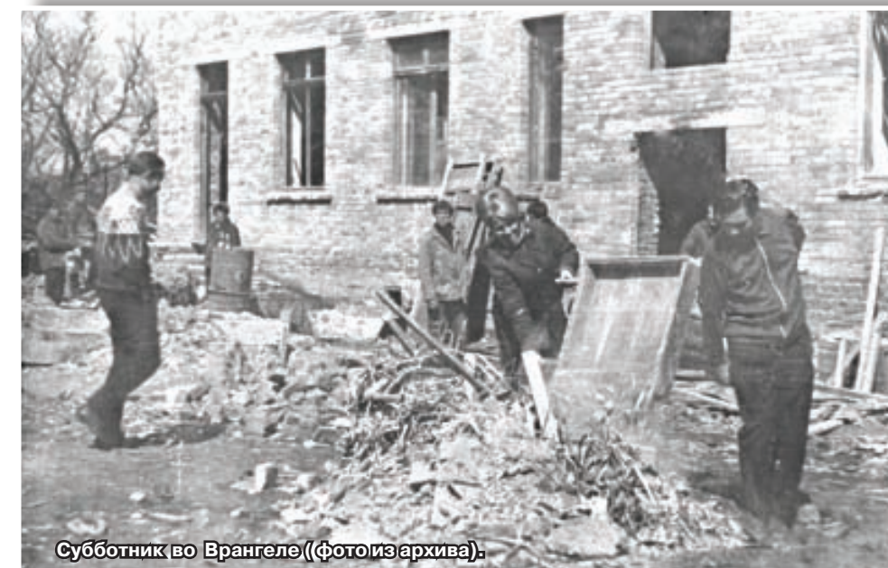
Субботник (во Врангеле) (фотоиз архива).